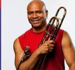
Robin Eubanks Trombone